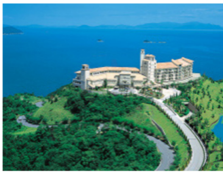
グランドエクシブ鳴門