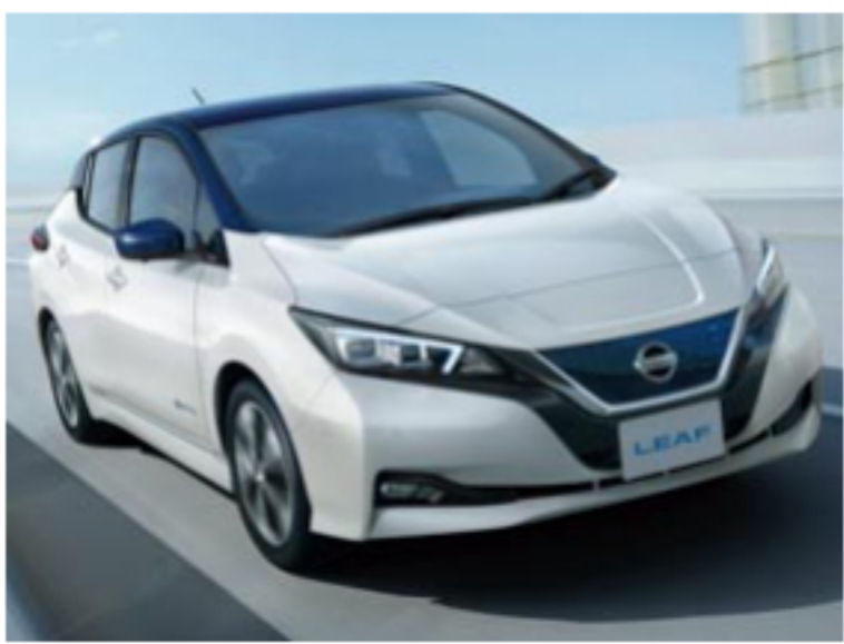
新車中古車購入時の割引

静岡日産自動車の社員は社員割引購入制度が利用できます。なんとこの社員割引は2親等の家族まで利用が可能です。2親等とは、本人または配偶者から数えて2世代のごと、つまり社員または配偶者の両親や祖父母、兄弟が社員割引で車を購入できます。