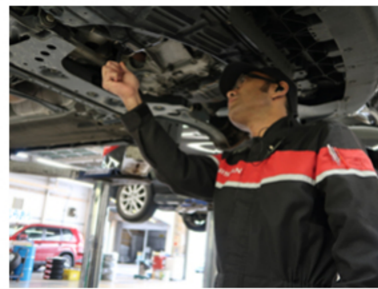
整備及び修理代の割引