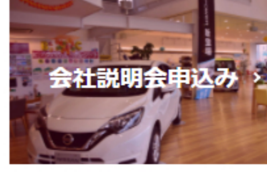
会社説明会申込み >