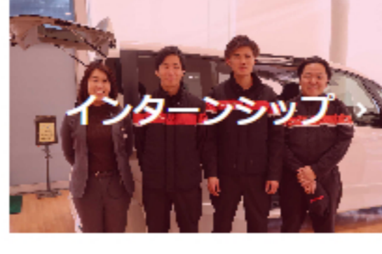
インターンシップ