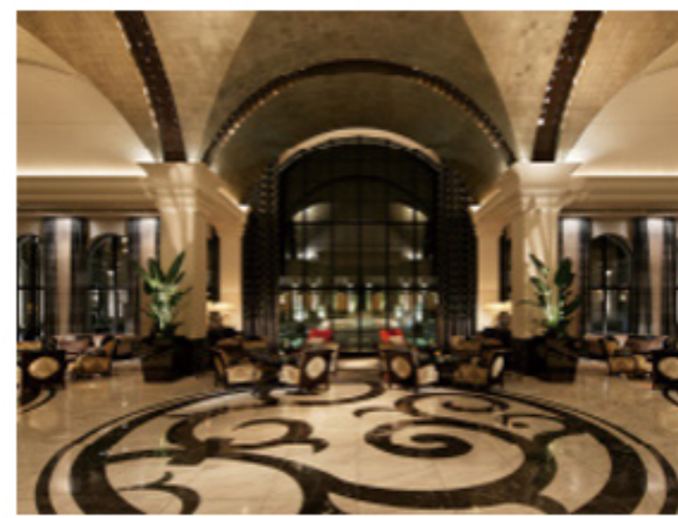
エクシブ有馬離宮