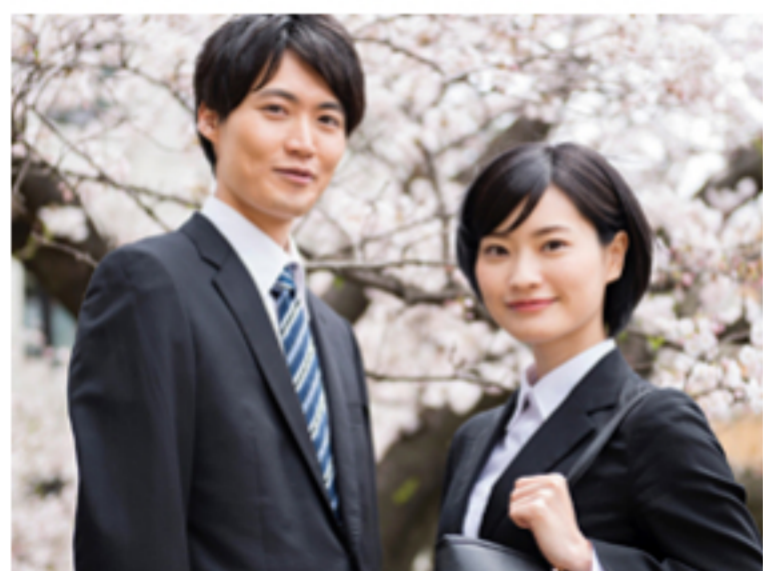
男女関係ないチャレンジ機会