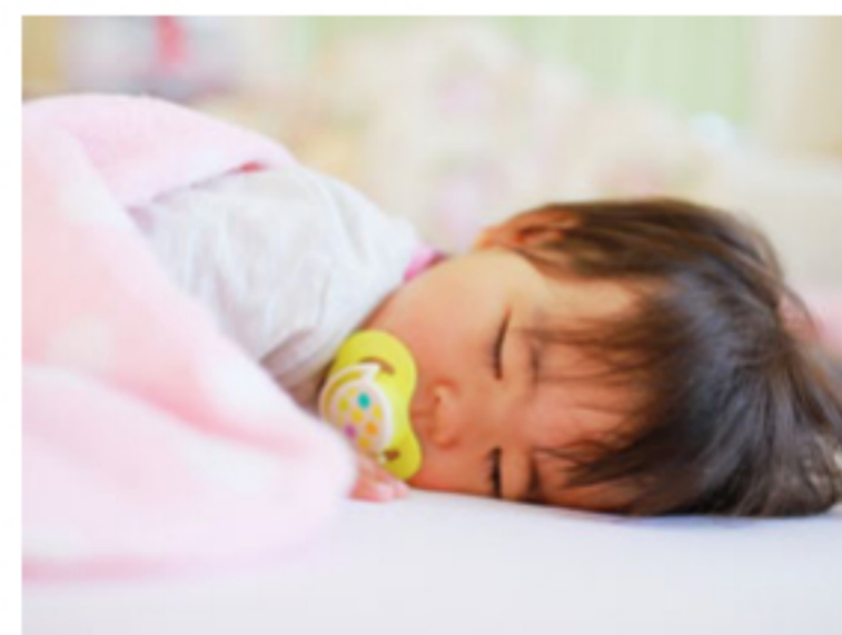
産休・育休を取得申請しやすい環境

女性も活躍できる会社を目指しています。どの職種においても男女関わらず同じチャレンジの機会がありますので、営業職でも活躍している女性の先輩が多く働いています。