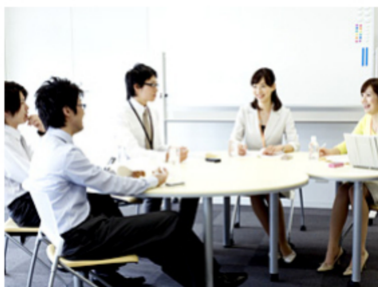
意見の言いやすい環境