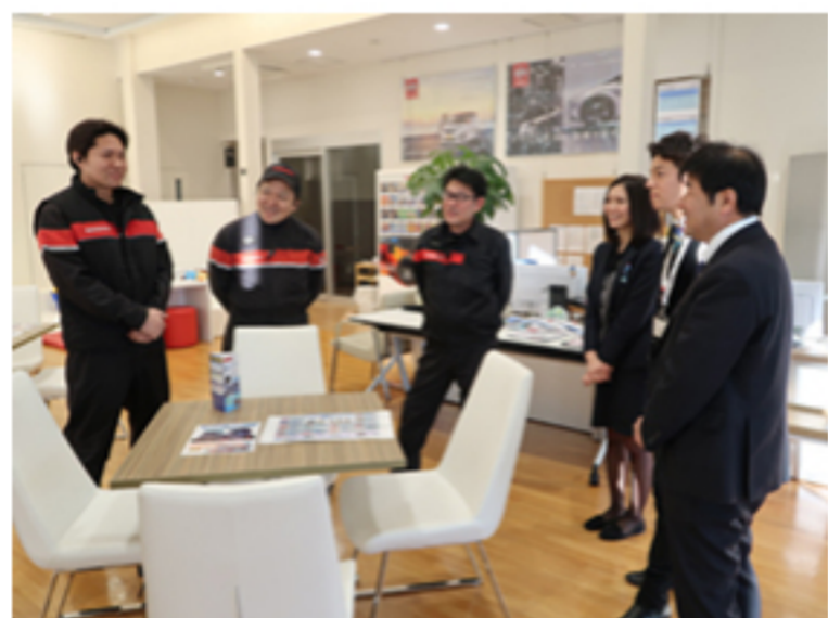
残業時間目標の設定